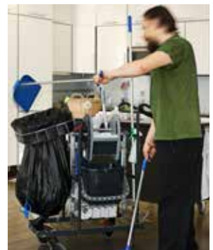
Das Longopac-System gibt es in einer Vielzahl von Ausführungen für die verschiedensten Zwecke. Paxxo bietet auch Lösungen mit Metallerkennung für Bereiche an, in denen dies erforderlich ist.