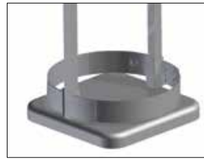
Umrandung für Longopac Stand Classic Maxi Item no. 33900

Zum einfachen und stabilen Verbinden mehrerer Longopac Stand-Einheiten. Auch Maxi und Mini lassen sich zusammenfügen.