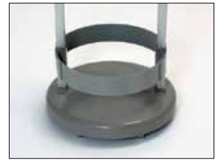
Umrandung für Longopac Stand Classic Mini Item no. 33890

Die Umrandung fixiert den Sack in seiner Position.