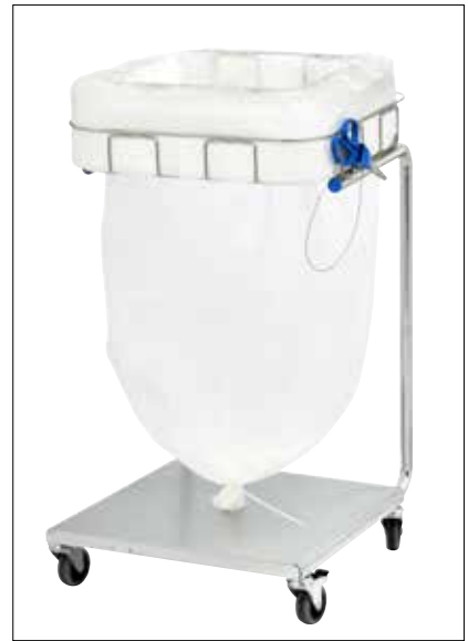
Stand Dynamic Maxi/Maxi Pedal